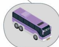
Автобус междугородного/международного следования

Проявите гражданскую позицию, поддержите «Стратегию Ноль» в России. Поделитесь с друзьями и близкими той информацией, которая показалась вам важной. Сделайте фотографию и разместите в VK Instagram Facebook #СТРАТЕГИЯНОЛЬ и #РОССИЯБЕЗДТП